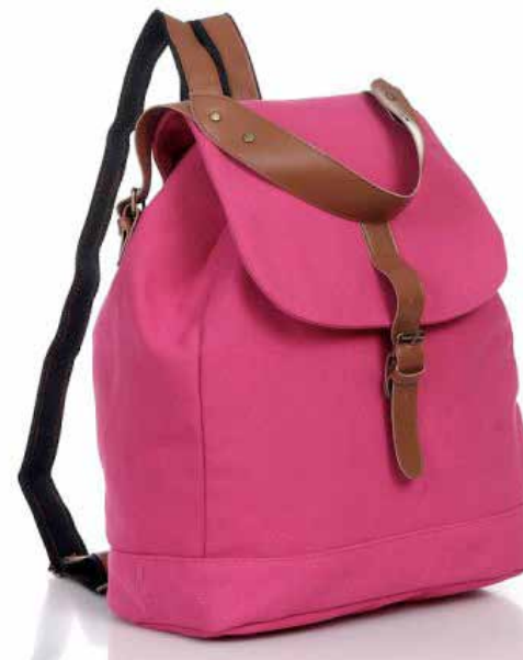
Рюкзак: 900 ₽