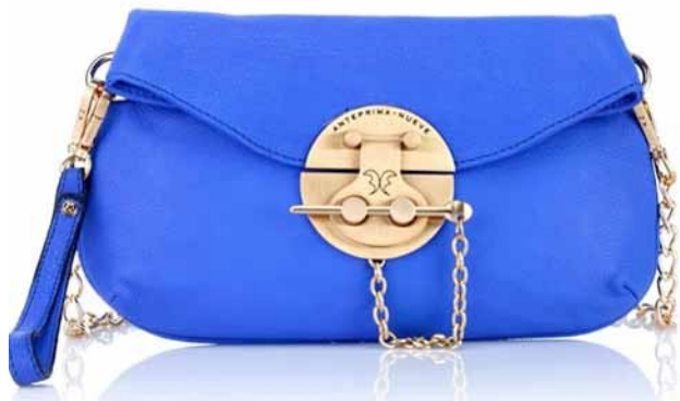
Сумка-клатч: 4500 ₽