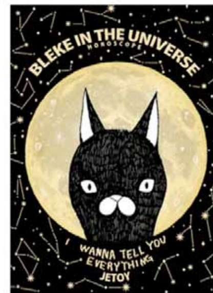
Дневник: 1090 ₹