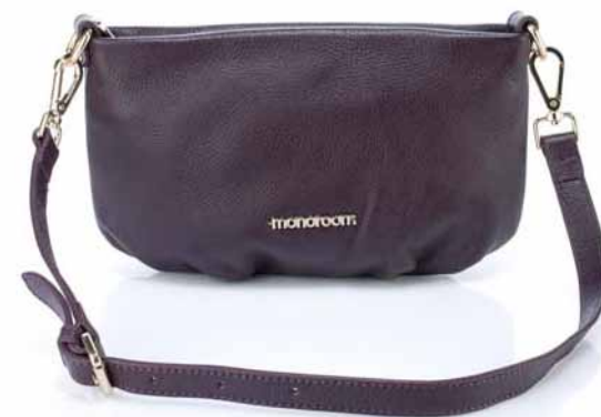
Сумка кожаная: 2200 ₽