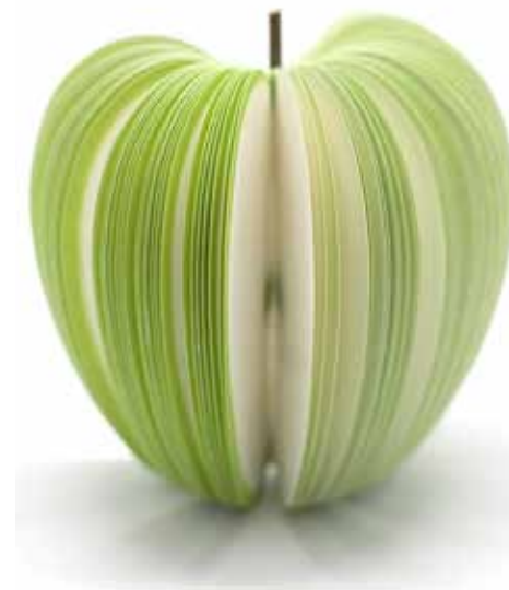
Отрывной блокнот: 150 ₹