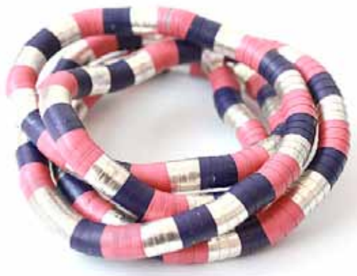
Колье-трансформер: 800 ₽