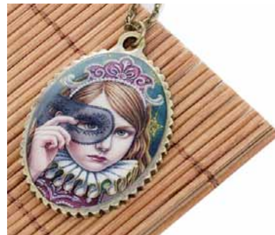
Медальон: 800 ₽