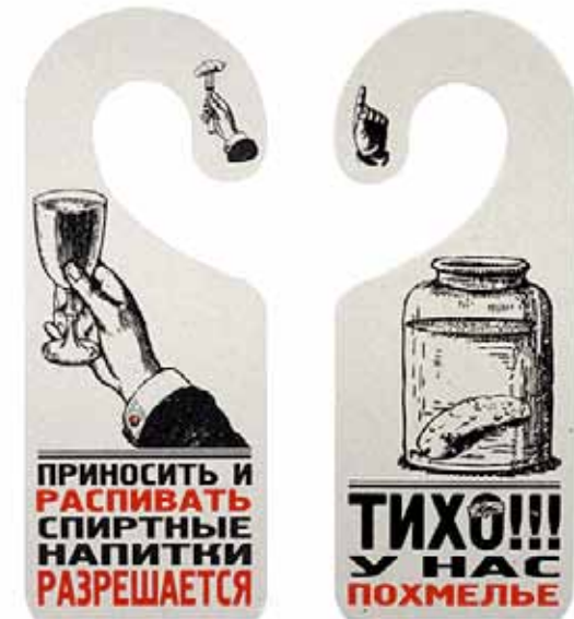
Табличка на дверь: 120 ₹