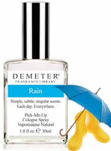
Парфюмерия: 1250 ₹