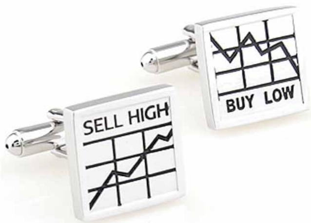
Запонки: 900 ₽