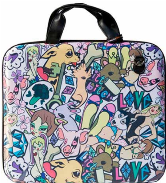
Кoffer для ноутбука: 2500 ₽