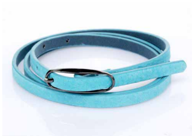
Ремни: 400 ₽