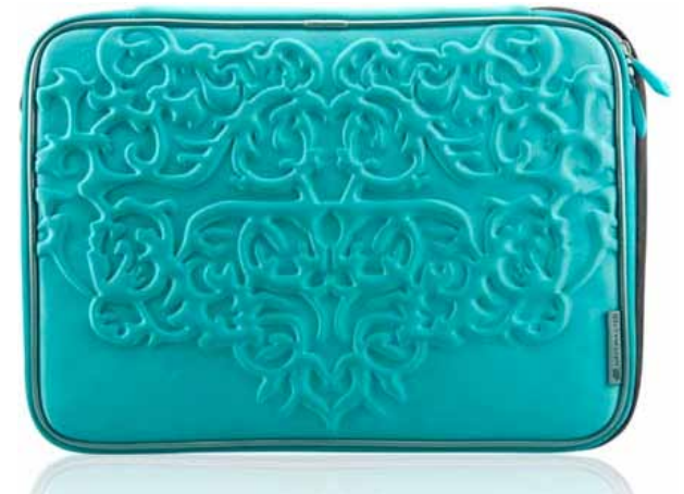
Чехлы для ноутбука: от 800 ₹