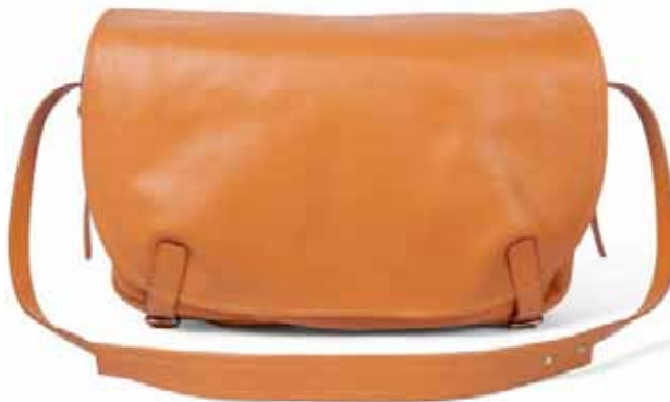
Сумка кожаная: 7000 ₽