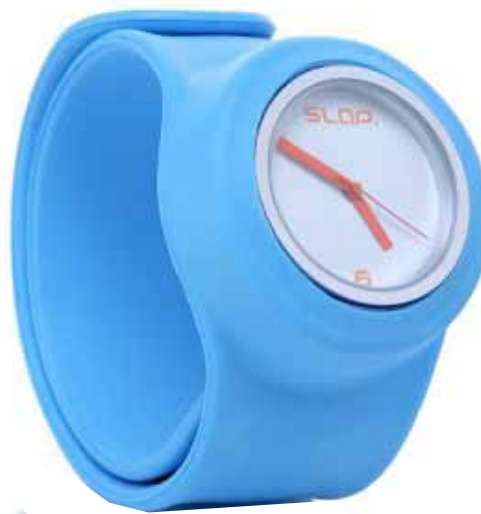
Слеп-часы: 700 ₹