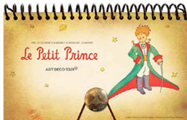
Еженедельник: 900 ₹