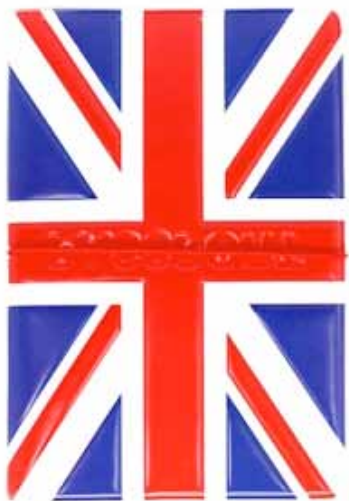
Паспортная обложка: 350 ₹