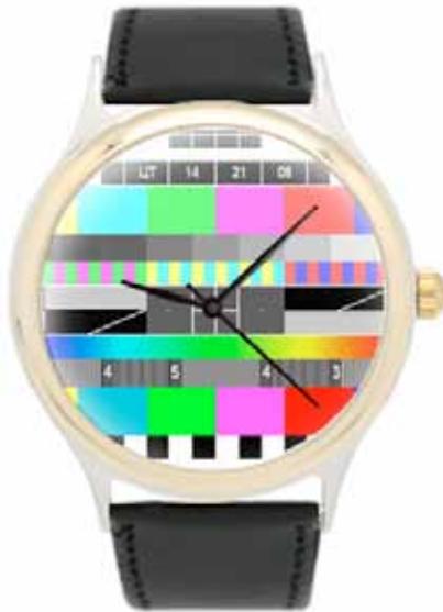
Часы: 990 ₹