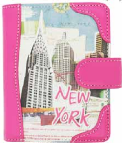
Кошельки: от 150 ₹