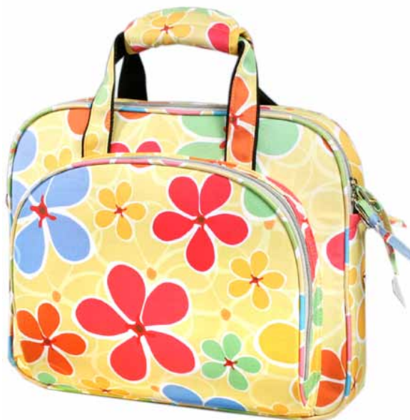
Сумка для ноутбука: 2200 ₽