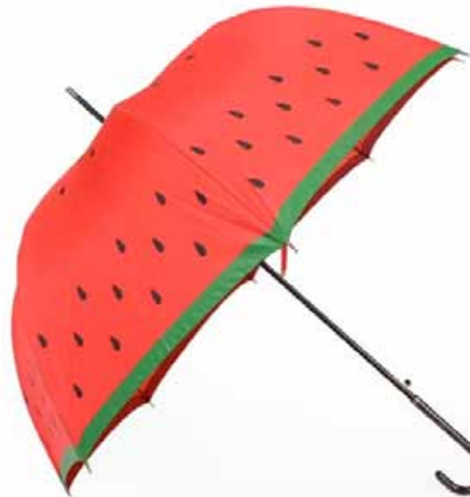
Зонты: ОТ 600 ₽