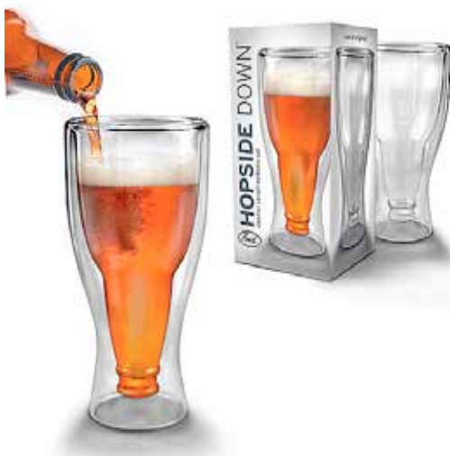
Бокал Hopside Down : 800 ₽